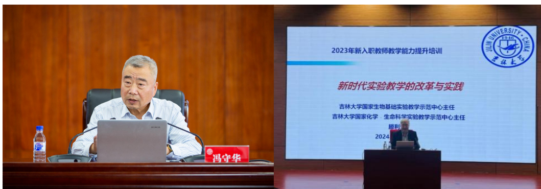
新入职教职工系列培训

推动骨干教师“锤炼”真本领。 组织教师发展及各类培训活动 63 场，覆盖教师 6000 余人次。围绕思政课程与课程思政建设，推出主旨午餐会系列活动；助推广大教师利用信息技术进行教学方法改革创新，开展“数智时代教育变革与创新”系列报告；充分利用学部、学院优势资源，开展教师教学发展进学院（学部）活动；搭建教师与学生沟通桥梁，开展“本科生班主任育人能力提升”系列培训；帮助教师缓解身心压力，组织“释压焕新，艺术滋养心灵”特别午餐会；拓宽教师国际视野，推出“吉林大学—剑桥大学教师全球胜任力提升项目”；推动教师队伍建设数字化转型，组织全校