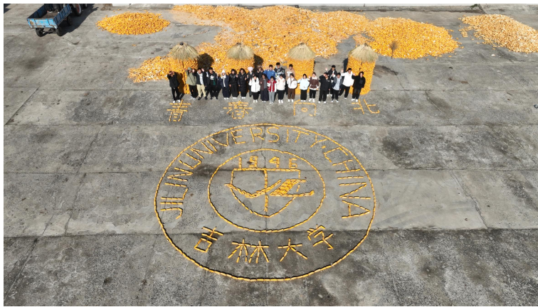
2024年“金秋劳动周”大学生劳动教育实践主题活动