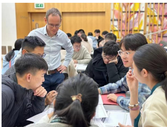
2024 年剑桥大学寒假项目

加强“本科生海外优质课程”项目的建设，将海外名师“请进来”，让师生近距离接触国际前沿，学习海外优质课程的教材、教学理念、教学方法等，最终扎根、融合、转变为本土教育资源。打开教育边界，在国际顶尖高校引进 137 门数字教育课程，覆盖理工农医文史经管各大学科门类，面向全校学生开放修读，选课人数 2850 人。