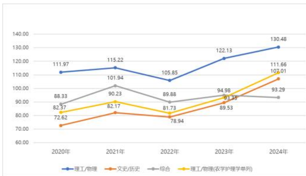
2020 年-2024 年录取分与一批次控制线的平均分差

港台学生 43 人。在区分文理的 10 个省份中，文史类在 5 个省份录取线超过该省份一批次控制线 80 分，3 个省份超过 100 分，与 2023 年相比较，6 个省份的录取分差稳步提升；理工类在 10 个省份录取线均超过该省份一批次控制线 80 分以上，其中 8 个省份超过 100 分，与 2023 年相比较，6 个省份的录取分差提升。在 6 个综合改革（3+3）省份中，在北京、山东录取线超过该省份一批次控制线 100 分，与 2023 年相比较，4 个省份的录取分差提升。在 15 个综合改革（3+1+2）省份中，历史类在 11 个省份录取线超过该省份一批次控制线 80 分，其中 6 个省份超过 100 分，与 2023 年相比较，10 个省份的录取分差提升；物理类在 14 个省份录取线超过该省份一批次控制线 80 分，其中 11 个省份超过 100 分，与 2023 年相比较，12 个省份的录取分差提升。