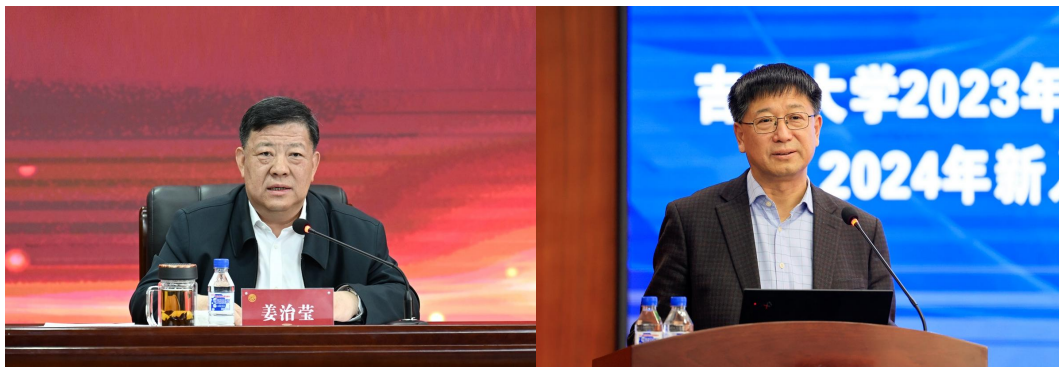
校党委书记、校长讲授专题党课及入职第一课