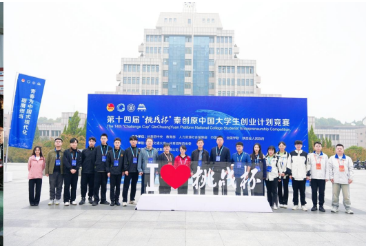
学校代表队参加挑战杯系列赛事

学校重视创业教育通识教育课程及双创成果平台建设 工作。2024 年，创新创业教育学院面向全校开设通识教育课程 21 门；通过 Spoc 平台创建课程 84 门，累计 38794 人次入班学习；举办“吉智创享”沙龙活动 8 期，参与人数 1000 余人。共选聘 102 位双创导师，开设“创新创业管理”微专业，并完成“吉创一期”招生培养工作。稳步推进创新创业教育期刊编辑出版工作，编辑出版《创新与创业教育研究》《吉林大学大学生创新创业训练计划优秀论文》，支持出版双创教材《数字创业》。为全校师生提供双创成果平台。