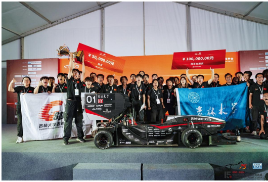
吉速方程式车队荣获 2024 中国大学生 方程式汽车大赛年度总冠军