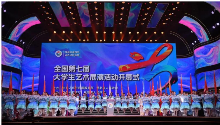
全国第七届大学生艺术展演

劳育固本，探索劳动教育新模式。 学校发挥综合性大学基础优势和东北老工业基地优势，以全面提高学生劳动素养为主要目标，制定出台《吉林大学全面推进劳动教育工作实施方案》《吉林大学本科学生劳动实践实施办法》。成立吉林大学劳动教育中心，建设农业实验基地和工程训练中心两个大型一站式劳动教育实践基地。统筹安排、整体推进劳动教育课程建设，2023年吉林大学劳动教育课以通识必修课的形式，在一年级1万余名学生中全面展开。首创综合性大学全国劳模领衔主讲“劳动教育课”品牌，通过“全国劳模劳动教育课”“劳模与学生面对面”等活动，突出劳动模范的示范引领和劳模精神的育人功能。建立健全劳动教育理论课教学体系，探索多样化理论与实践相结合的劳动教育课程，持续推出“五一劳动周”“金秋劳动周”“农耕文化节”“启耕节”等劳动教育实践活动。2024年累计开展实践课程和主题活动200余场，2023、2024级本科生11000余人次参加。