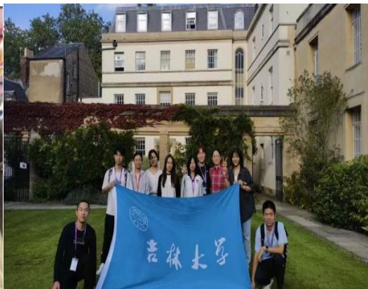
2024 年牛津大学暑期项目