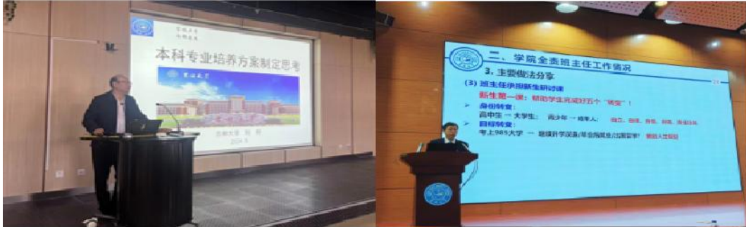
常态化教学系列培训

教师参加 2024 年暑期教师线上研修活动；举办“立德为师”青年主题培训，进行国情社情研修活动。