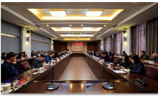
教学委员会专题研究本科教育教学改革 教育教学督导委员会思政课反馈会